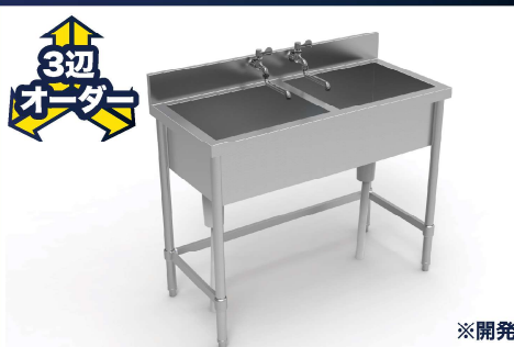
大型ダブルシンク KYSW-01