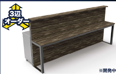
カウンターテーブル KYCT-01