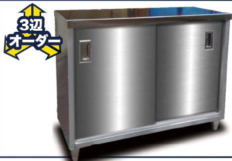
キャビネット調理台 KYK-01